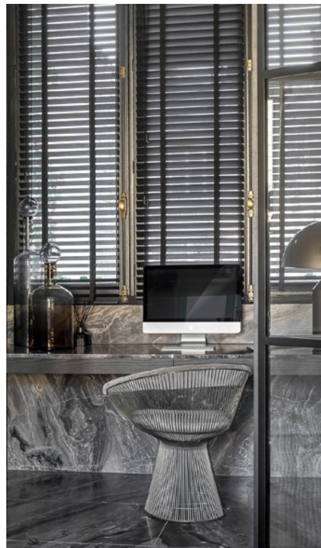
Interior design and stylism by atelier.daaa