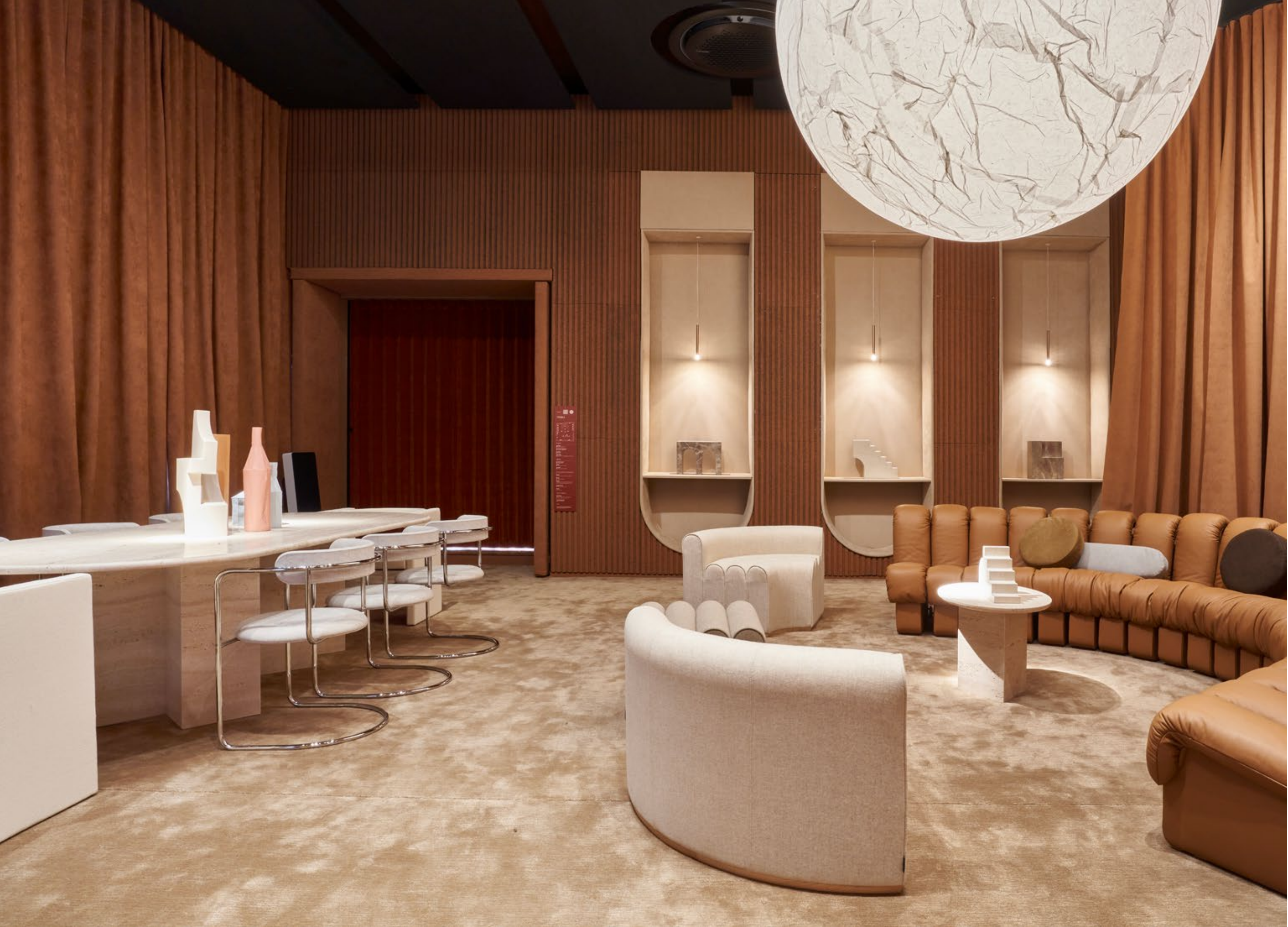
TERRA - inspired by Earth

Un gioco di toni caldi e un richiamo alle sfumature primitive della terra in contrasto a volumi monolitici.