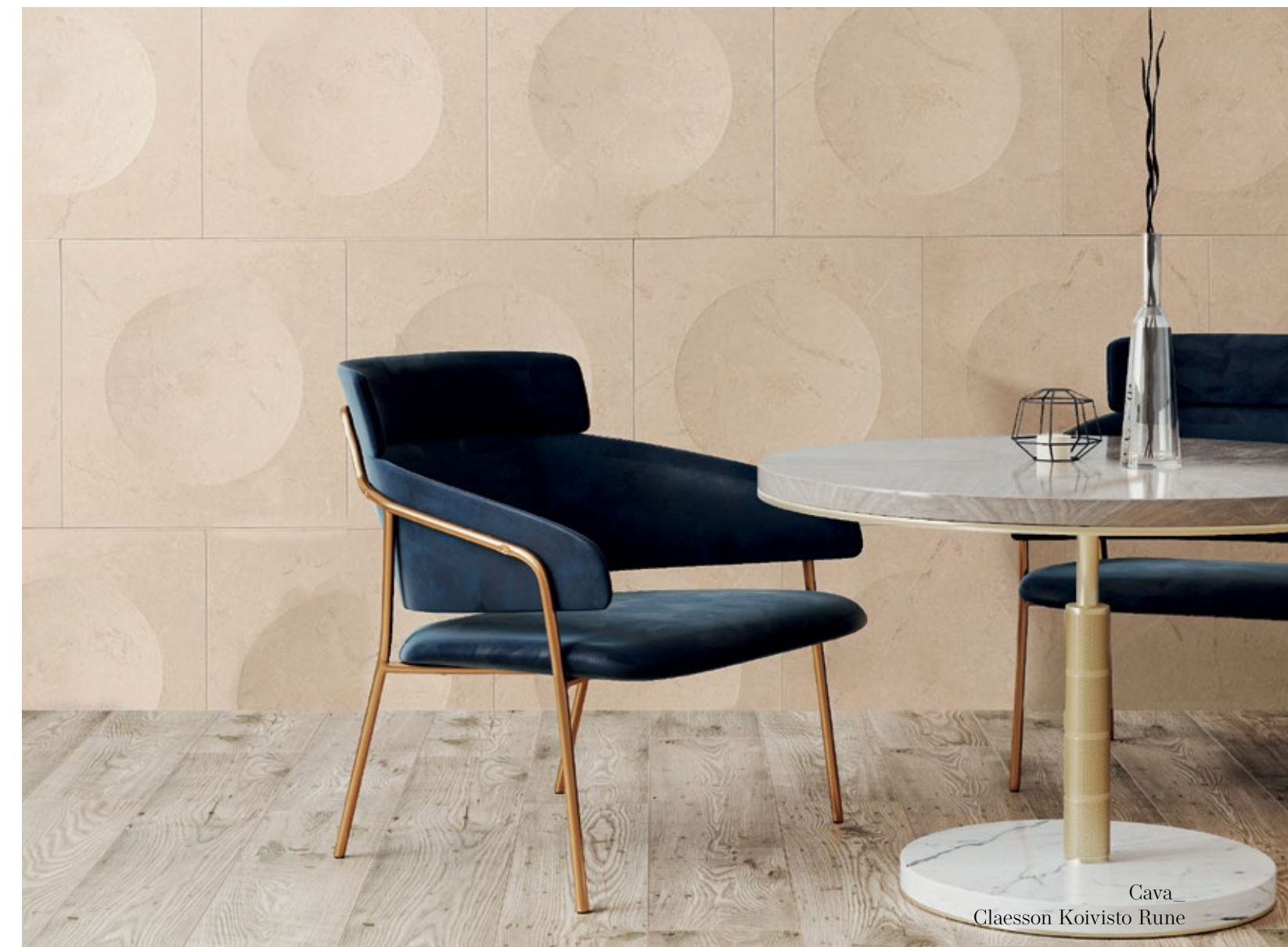
Cava_ Claesson Koivisto Rune

Available in two different sizes, the sinuosity of the circular element translates into an iconic and primordial shape, to give simple originality to a composition that can make the atmosphere of an environment always new.