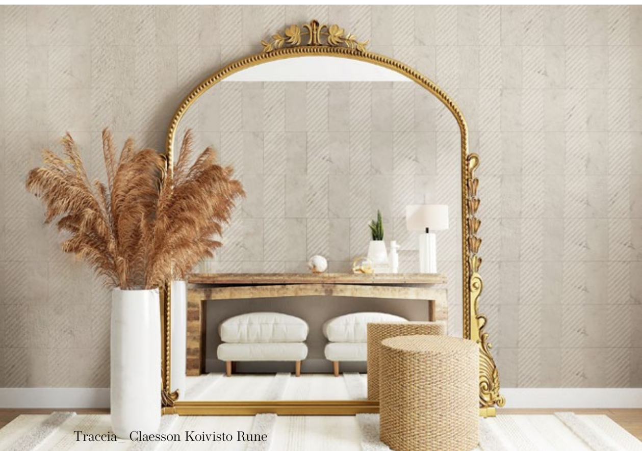
Traccia_ Claesson Koivisto Rune