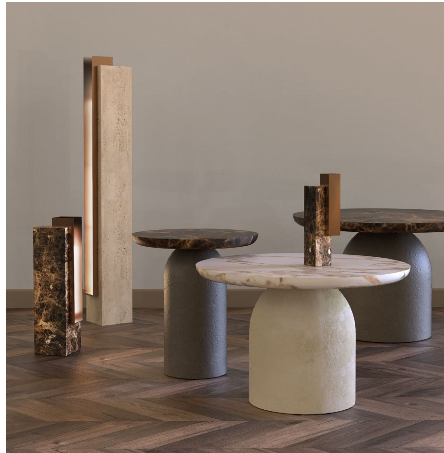
Saturo, coffee tables_Silvio Girolamo Specchia, lamps_Félix Millory Sabina, candle holder_Félix Millory