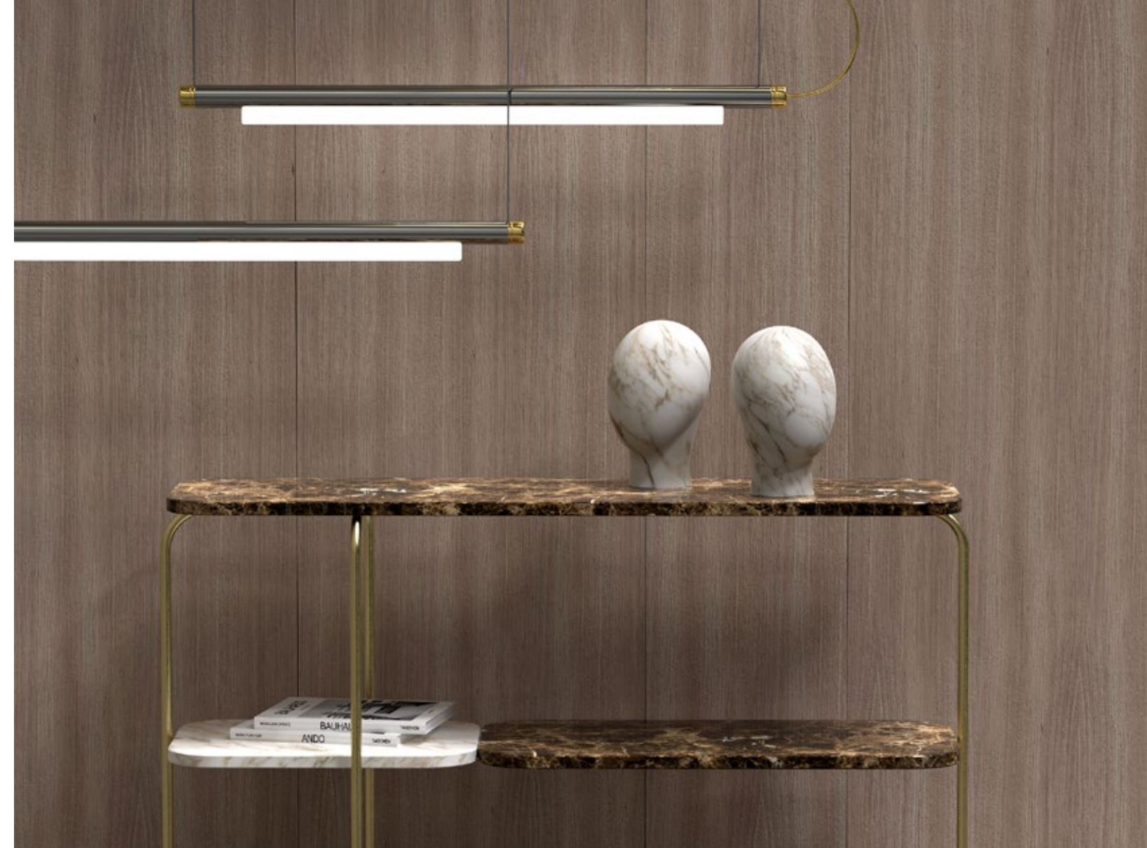
Molina, console_Bonacina + Macrì Galerie, sculpture_Bonacina + Macrì