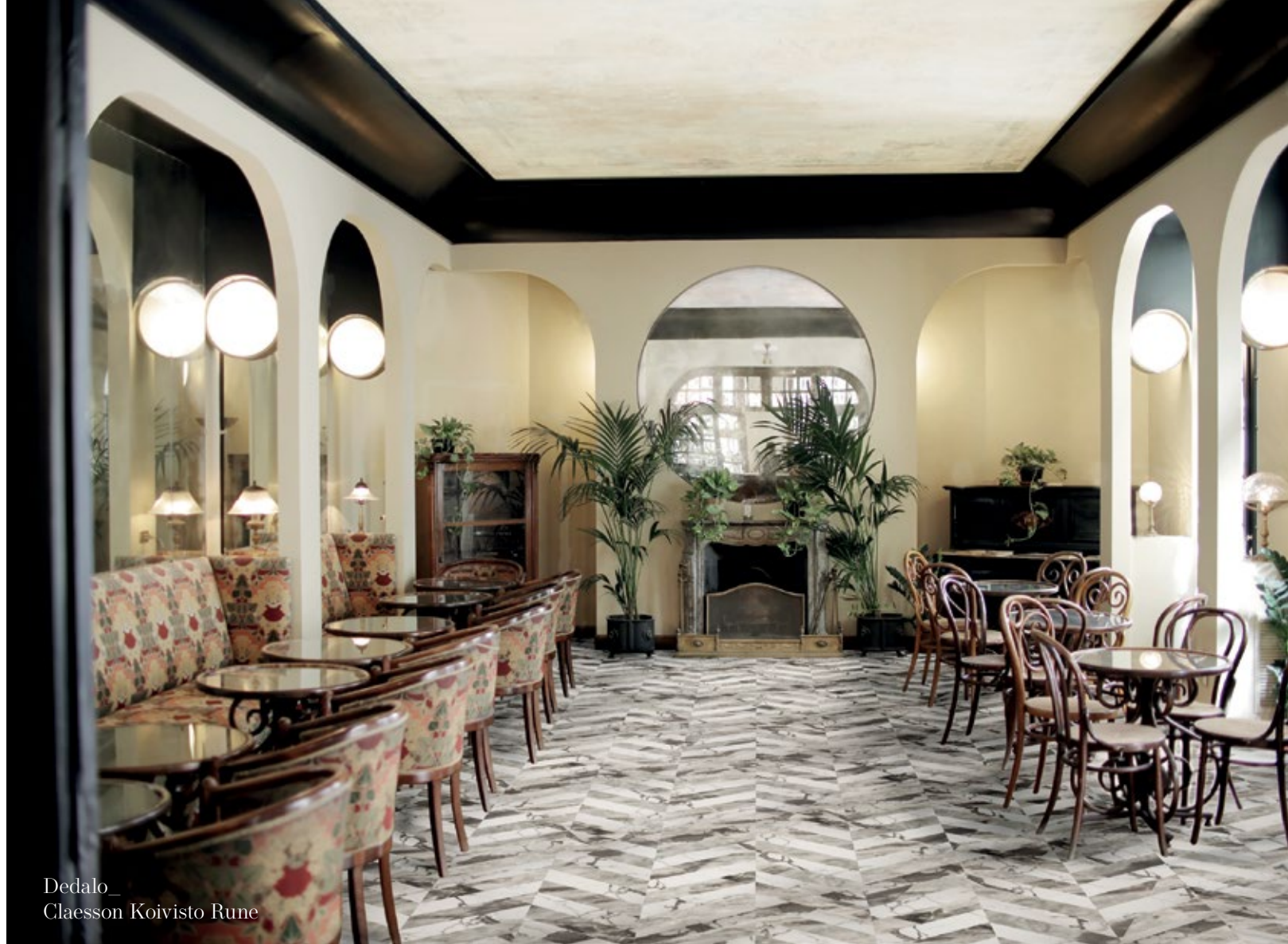
Dedalo_ Claesson Koivisto Rune