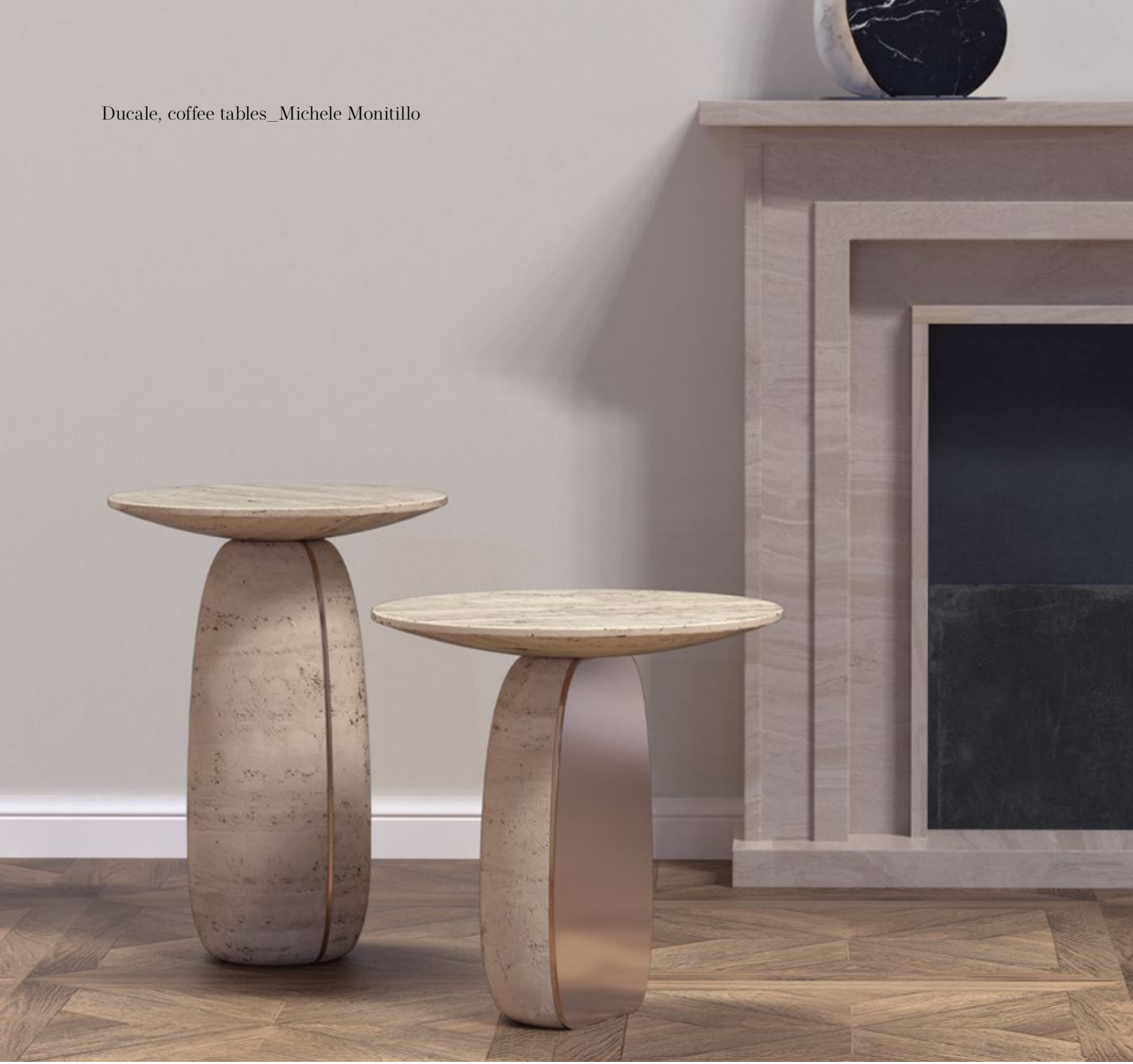
Ducale, coffee tables_Michele Monitillo